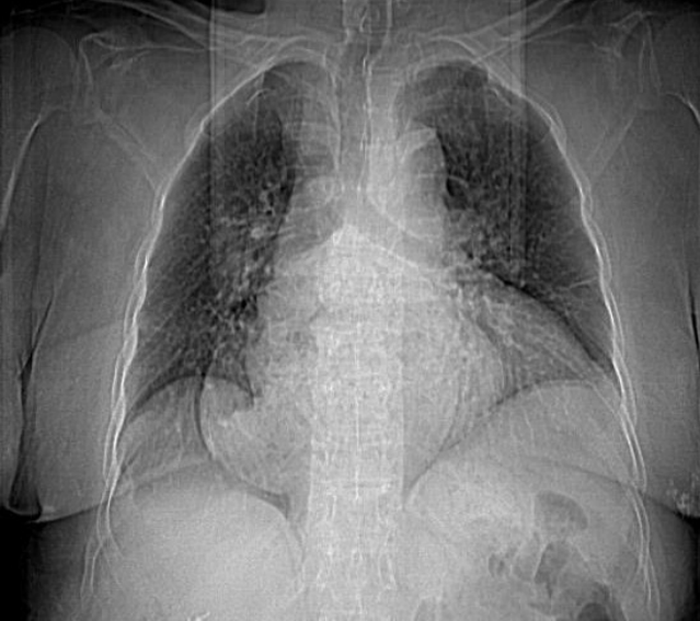
Resim 1. Akciğer grafisinde mediastinal genişleme görünümü

Frenoözofagial ligamentin fokal ya da difüz zayıflamasına bağlı olarak mide fundusu, kardiyoözofagial bileşke ya da bunlarla beraber intestinal komponent mediastene fıtıklaşabilir. Hiatal herniler asemptomatik olabileceği gibi, obstrüksiyon, kanama gibi ölümcül komplikasyonlarla seyredebilir. 70 yaşında kadın hasta nefes darlığı, hazımsızlık şikayetleriyle başvurdu. Çekilen akciğer grafisinde mediastinal genişleme saptanması üzerine toraks tomografisi çekildi. Özofagial hiatustan mediastene totale yakın herniasyonu saptandı. Operasyonu kabul etmeyen hasta poliklinik takibine alındı.